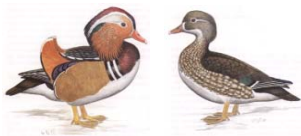
Mandarinente (Aix galericulata)