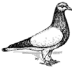
Coburger Lerche silber ohne Binden