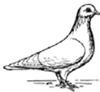
Arabische Trommeltaube weiß