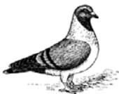
Mährische Strasser stahlblau